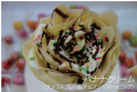
バナナクリーム (チョコスプレー&チョコソーストッピング)