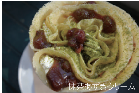
抹茶あずきクリーム