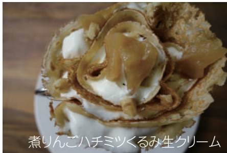
煮りんごハチミツくるみ生クリーム